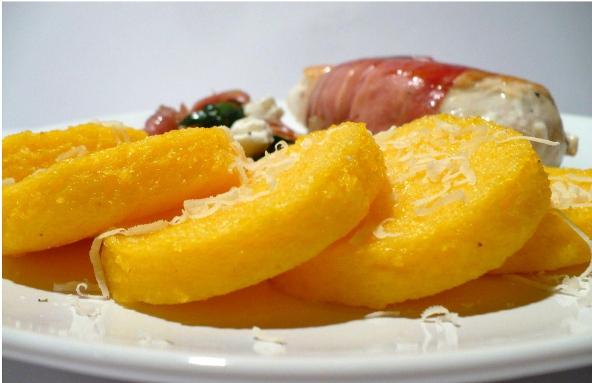
Abbildung 1 Typische Tessiner Polenta muss schnittfest sein! (Essen aus Engelchens Küche, 2011)

Wie überall, wurde gegessen, was man hatte: Den Mais und das Getreide, die man anbaute; Milch und Käse von den Kühen und Ziegen und deren Fleisch; Pilze, Beeren und Kräuter und natürlich Kastanien gehörten zu den Hauptnahrungsmittel. Die Polenta war sehr beliebt, da sie günstig und nahrhaft war aber auch wieder aufgewärmt noch gut schmeckte. Der Reis hingegen wurde im Tessin noch nicht angebaut und war deshalb für das einfache Volk nicht erschwinglich. (Weiss, 2006)