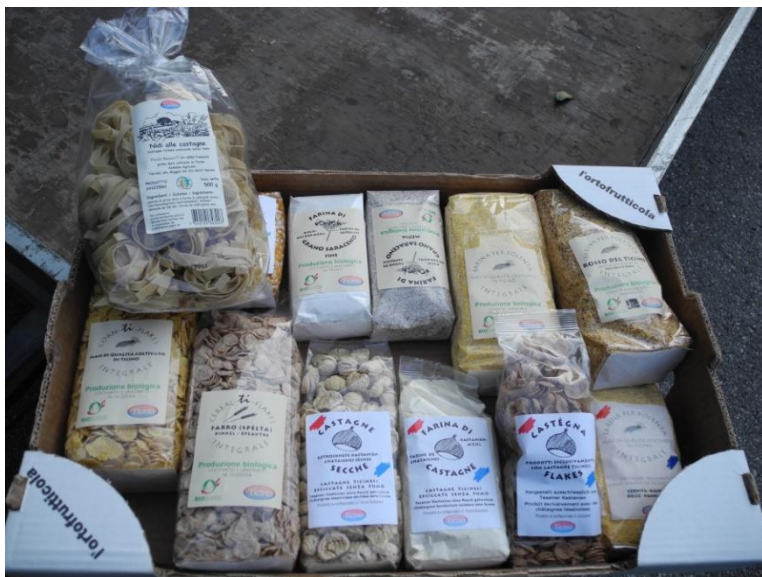
Abbildung 2 Auswahl aus der Produktpalette der Firma «Paolo Bassetti – prodotti e servizi agricoli» in Cadenazzo, Ticino.

Mit den modernen Transport- und Produktionsmöglichkeiten hat sich das ganze natürlich geändert und man kann auch im Tessin im Winter Erdbeeren kaufen.