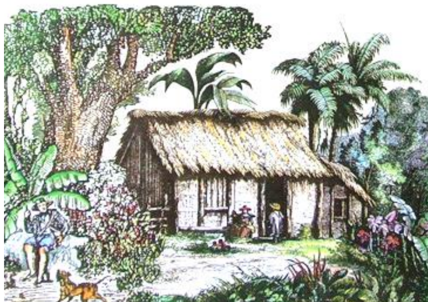
Abbildung 1: Ibicaba. Das Paradies in den Köpfen (Hasler, 1985)

Erst seit wenigen Jahrzehnten wird die Schweiz als typisches Einwandererland angesehen. Die Datenlage zeigt auf, dass für die Schweiz bis zum wirtschaftlichen Aufschwung Ende des 19. Jh. die Wanderungsbilanz stets negativ war. Bis zu Beginn des 19. Jh. war der Eintritt in fremde Kriegsdienste der weitaus häufigste Grund zur Auswanderung. Danach nahm die Emigration vor allem nach Nord- und Südamerika, ausgelöst durch die in dieser Arbeit aufgeführten Faktoren, neue Dimensionen an. Insgesamt wanderten in dieser Epoche je nach Schätzung zwischen 55 und 65 Millionen Europäer aus (Ritzmann-Blickenstorfer, 1991, S. 13). Während den Weltkriegsjahren kam die Auswanderung schliesslich wieder beinahe zum Stillstand. Einwanderungsbeschränkungen in den Überseeländern und der wirtschaftliche Aufschwung der Schweiz veränderten die Formen der Emigration. So ist sie seit Mitte 20. Jh. überwiegend temporär und aus beruflichen sowie Ausbildungsgründen. Auch finden sich heute im Gegensatz zu früher etwa gleich viele Frauen wie Männer unter denen, die eine neue Existenz in der Ferne aufbauen wollen ((HLS) & Jorio, 2002).