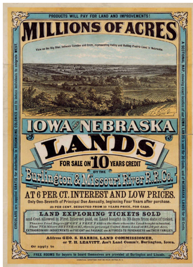
Abbildung 4: Auswirkungen des Homestead Act

Ein weiterer Grund war auch der technische Fortschritt, so fuhr im Gegensatz zu 1850 kaum mehr jemand mit einem Segler sondern Dampfschiffe beherrschten die Weltmeere. Neu dauerte die