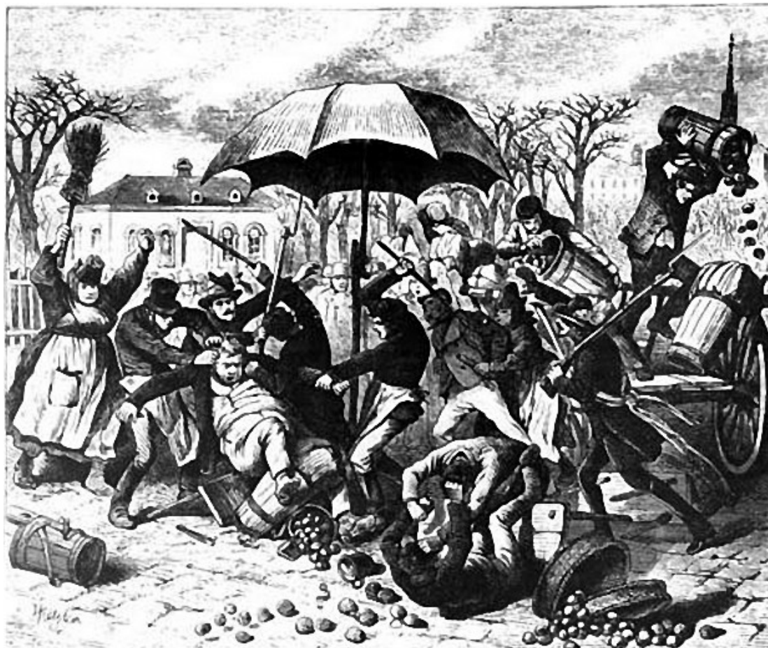
Abbildung 3: Kartoffelrevolution 1847 (Katzler)

Verfolgten fanden meist Asyl in Übersee oder wurden gar ins Exil geschickt. (Uni-Protokolle - Märzrevolution)